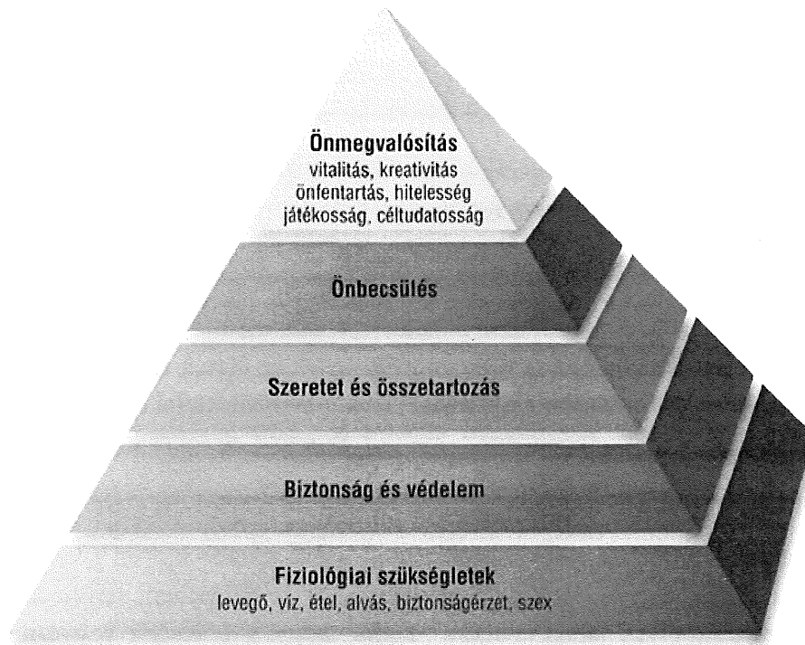
1. ábra Maslow piramis